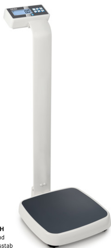
KERN MPN-P mit Stativ