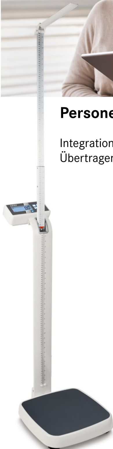
KERN MPN-H mit Stativ und Größenmessstab

Integrationsfähige Personenwaagen zum drahtlosen Übertragen der Wägedaten an EMR- oder EHR-Systeme